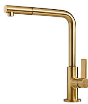
VELA PLUS GOLD satiniert 8498 129