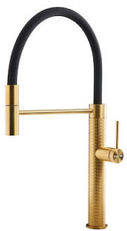
Mischbatterie Skin Gold 8424 859