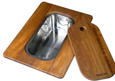
Schneidebrett Twin aus Iroko-Holz mit Küchensieb aus Edelstahl 8644 044