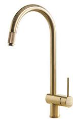
VOLTA GOLD 8491 109