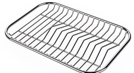
Tellerständer aus Edelstahl 8100 154

* nur in Kombination mit dem Zubehör 8644 101